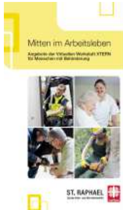
Flyer für Beschäftigte und Beschäftigungsgeber