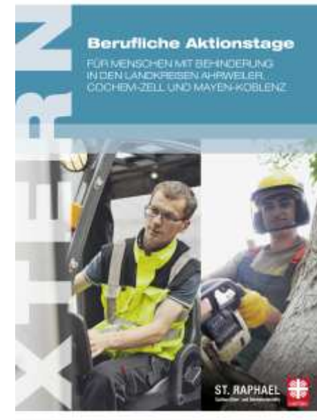
Konzept Berufliche Aktionstage