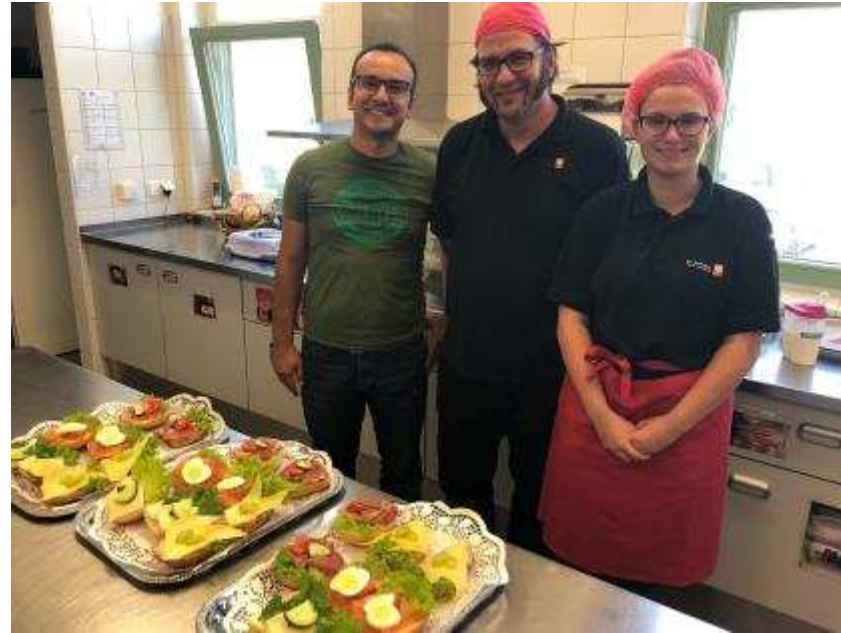
Mehrgenerationenhaus beides in Bad Neuenahr-Ahrweiler